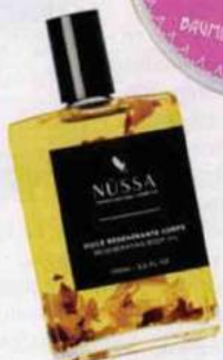
Précieuse. Huile régénérante pour le corps, Nüssa, 69 €.