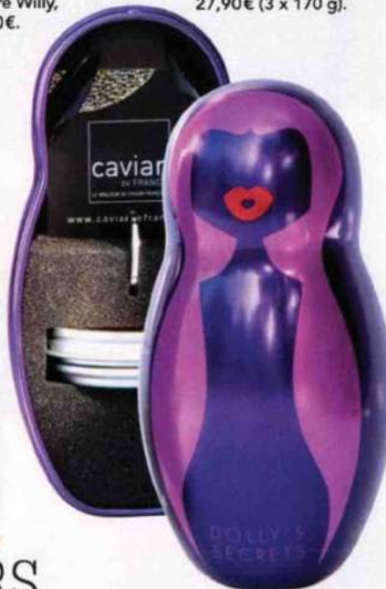
Raffiné. Coffret Dolly's Secret (1 boîte de caviar 20 g et 2 cuillères), Caviar de France, 39 €.