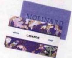
Ancestral. Savon traditionnel à la lavande, Molinard, 2,80 €.