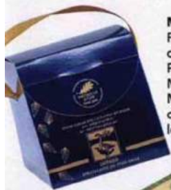
Médaille. Foie gras de canard du Périgord au Monbazillac, Maison Godard, 24,50 € les 180 g.