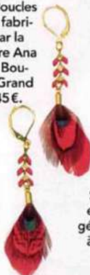
Légères. Boucles d'oreilles fabriquées par la plumassière Ana Gold, La Boutique du Grand Palais, 45€.