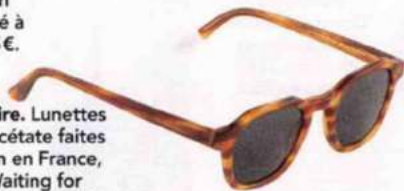
Solaire. Lunettes en acétate faites main en France, Waiting for The Sun, 129€.