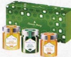
Royal. Miels à la spiruline, curcuma et gelée royale, Famille Mary, 27,90 € (3 x 170 g).