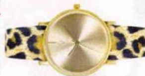
Féline. Montre en cuir à bracelet interchangeable, fabriquée en Auvergne, Laruze, 169€.