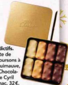
Addictifs. Boîte de 16 oursons à la guimauve, La Chocolaterie Cyril Lignac, 32 €.