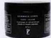
Tonique. Gommage corps au sucre et marc de café recyclé, Prescription Lab, 26 €.