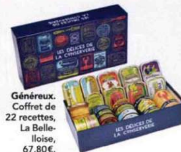
Généreux. Coffret de 22 recettes, La Bellelloise, 67,80 €.