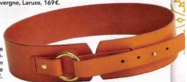
Stylée. Ceinture en cuir tanné végétal cousue main à Asnières, Aline Schmitt, 120€.