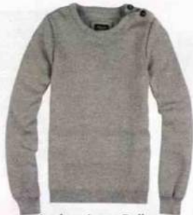
Authentique. Pull en laine mérinos fabriqué à Roanne, Hoalen, 145€.