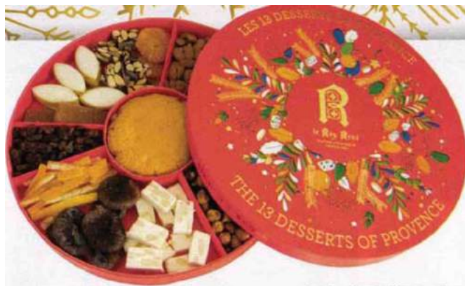
Traditionnel. Coffret de 13 desserts provençaux, Le Roy René, 39,90 €.