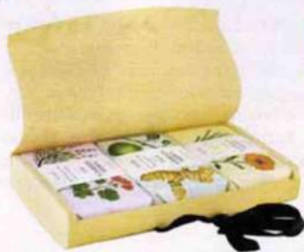
Biologique. Coffret 3 Savons, Savon Stories, 26 €.