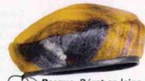
Basque. Béret en laine mohair et laine vierge fabriqué dans les Pyrénées, Laulhère, 140€.