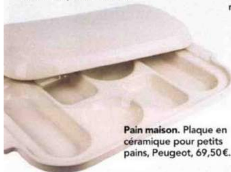
Pain maison. Plaque en céramique pour petits pains, Peugeot, 69,50 €.