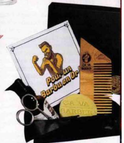
Complet. Coffret de soins de la barbe, Ça va barber!, 65,90 €.