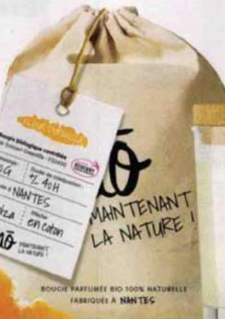
Naturelle. Bougie parfumée bio fabriquée à Nantes, Naô, 16,90 € (200 g).