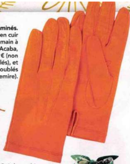
Vitaminés. Gants en cuir fait main à Paris, Acaba, 59€ (non doublés), et 72€ (doublés cachemire).