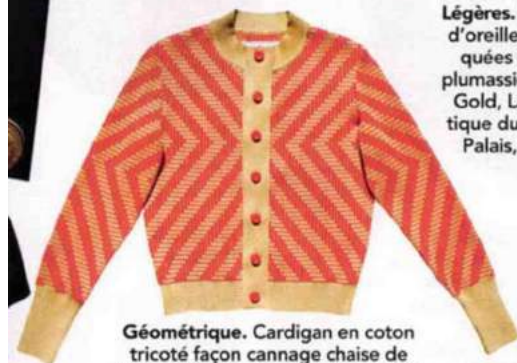
Géométrique. Cardigan en coton tricoté façon cannage chaise de bistro, fait à Paris, Bourguine, 195€.