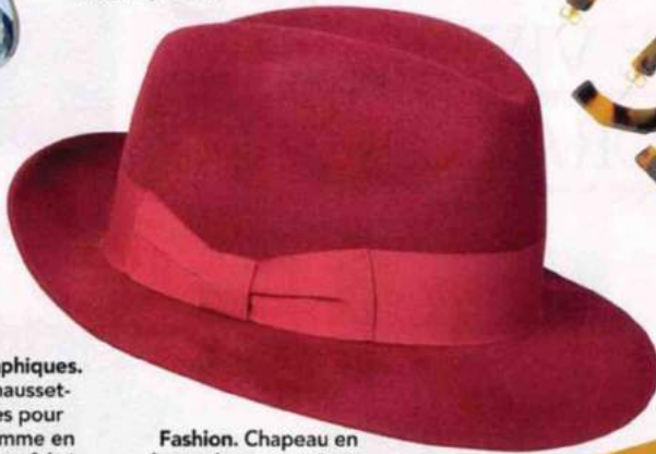
Fashion. Chapeau en feutre fait main à Paris, Courtois Paris, 198€.