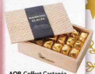
AOP. Coffret Castaneaé, 36 marrons glacés d'Ar-dèche, Sabaton, 61 €.