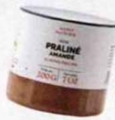
Régressive. Pâte à tartiner Praliné Amande, Mazet, 11,70 €.