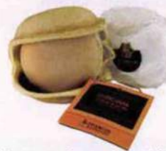
Voyageur. Savon Ayurvédique Curcuma Orange & Girofle, Karawan Authentic, 7 €.