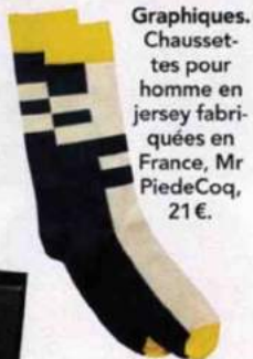
Graphiques. Chaussettes pour homme en jersey fabriquées en France, Mr PiedeCoq, 21€.