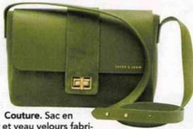
Couture. Sac en cuir et veau velours fabriqué à la main dans le Tarn, Jules & Jenn, 195€.