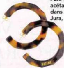
Fun. Créoles en bio-acétate, façonnées dans un atelier du Jura, Patine, 60€.