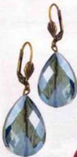
Glamour. Dormeuses en verre taillé faites main à Paris, Luce Paris, 25€.