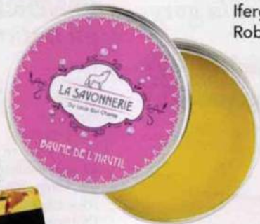
Multi-usage. Baume de l'Hautil, La Savonnerie Du Loup Qui Chante, 7,50 €.