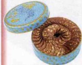
Délicats. Pétales de chocolat aux éclats de feuille d'or, Boissier, 27 € les 195 g.