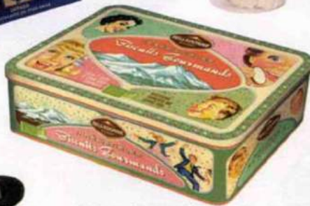
Collector. Boîte Irrésistibles Biscuits Gourmands, cannelle, orange-chocolat, Belledonne, 13,40 € les 260 g.