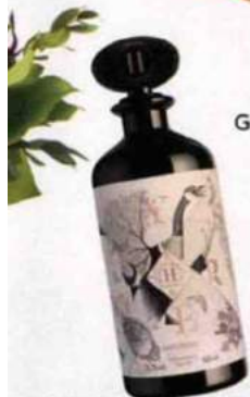
Epicée. Liqueur Hystérie, cardamome, passion, cranberry... H. Theoria, 60 € les 50 cl.