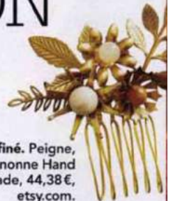
Raffiné. Peigne, Mignonne Hand Made, 44,38 €, etsy.com.