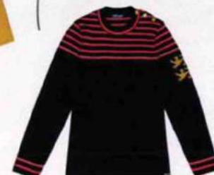
Emblématique. Marinière en laine brodée, fabriquée sur les machines historiques normandes, Saint James, 169€.