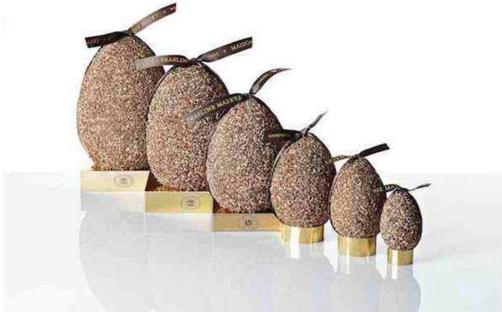
Oeufs de Pâques par Mazet®