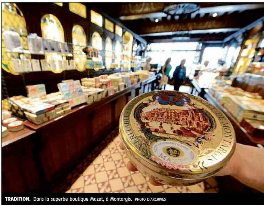
TRADITION. Dans la superbe boutique Mazet, à Montargis.

Depuis que ce label a été créé en 2005, peu d'entreprises s'en prévalent : 1.400 en France, 48 dans la région (représentant 1.800 emplois et 154 millions d'euros de chiffre d'affaires), dont 23 métiers d'art, et seulement sept dans le Loiret (lire