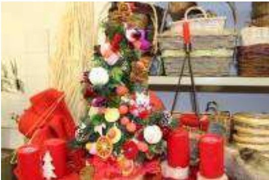
Fabriquer un sapin en bonbons pour Noël