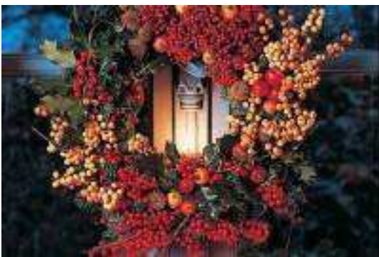
Bougies, couronnes, centre de table : faire ses décorations de Noël