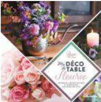
Ma déco de table fleurie