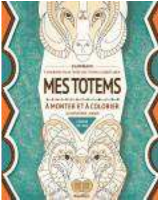
totems à monter et à colorier