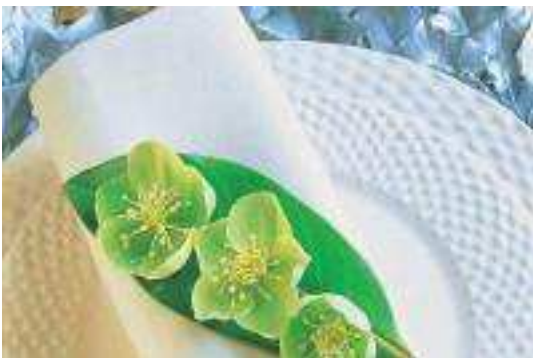
Noël : 6 décors de table glanés au jardin