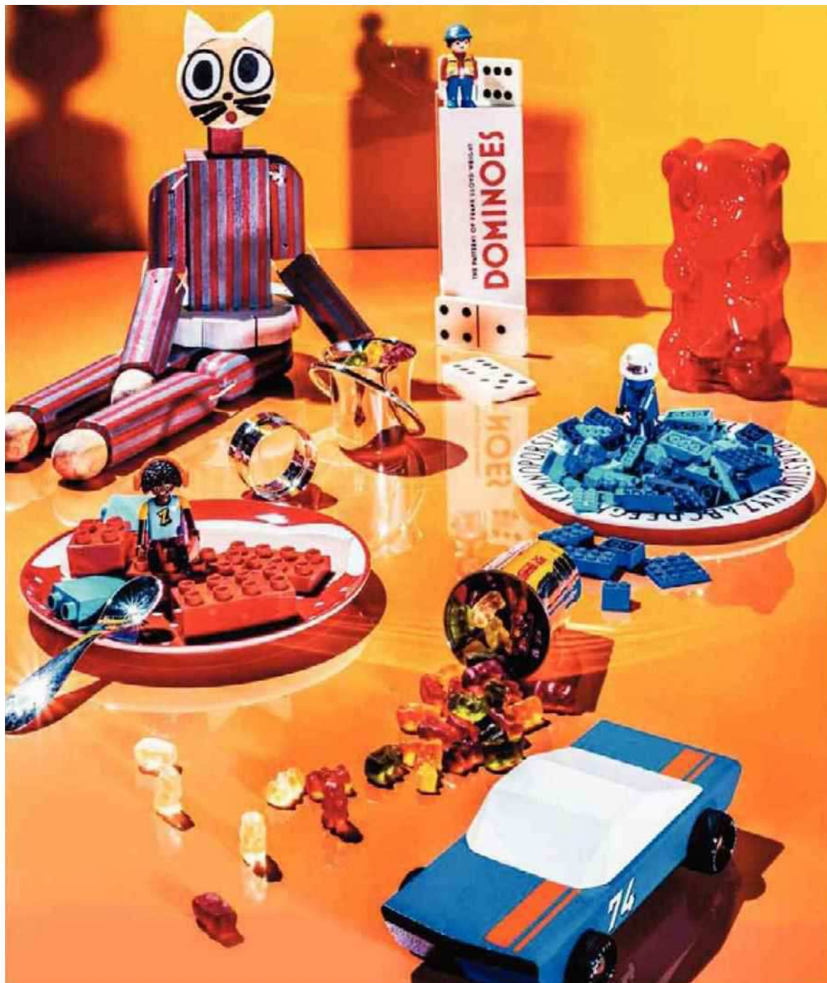
MENU ENFANT. De gauche à droite et de haut en bas : pantin en bois, MARNI VISITORS, 260 €. Timbale en métal argenté, Houpla, ERCUIS, 155 €. Boîte de 28 dominos en bois Frank Lloyd Wright, GALISON, 32,99 €. Figurines conducteur de chantier, DJ et policier, PLAYMOBIL, à partir de 3,90 €. Lampe veilleuse Gummie Bear rouge, THE CONRAN SHOP, 39 €. Assiette à dessert Père Noël rouge, MONOPRIX, 3,99 €. Culler en métal argenté, Babystar, CHRISTOFLE, 100 €. Rond de serviette et timbale en argent massif, Concorde, RICHARD ORFÈVRE, 171 € et 416 €. Assiette en mélamine, collection Arne Jacobsen, MERCI, 10 €. Dans les assiettes, briques Lego Duplo « Jardin en Fleurs » et briques créatives de luxe Lego Classic, LEGO à LA GRANDE RÉCRÉ, 29,99 € et 54,99 €. Bonbons en gomme, Ours d'Or, HARIBO. Voiture en bois, CandyLab chez COLETTE, 38 €.