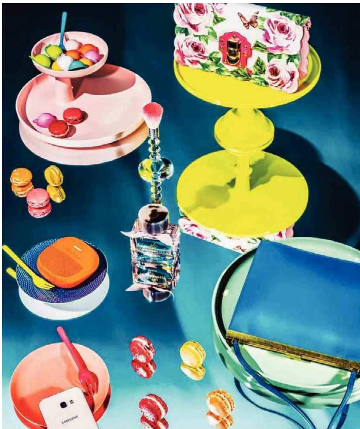
CHARIOT DES DESSERTS. De gauche à droite et de haut en bas : plateau rose à deux étages, Rotary tray, Jasper Morrison, 2014, VITRA, 47 €. Capsules de crème de douche, SEPHORA, 10,95 € la boîte. Petites fourchettes et plat sur pied jaune, en mélamine, Rice chez SMALLABLE, 5 € les six et 29 €. Pinceau en cristal BACCARAT, édition limitée à 30 exemplaires, Météorites, GUERLAIN, 350 €. Sac en cuir rose imprimé Lucia, DOLCE & GABBANA, prix sur demande. Assiette à cocktail en porcelaine, Trésor bleu, RAYNAUD, 34 €. Enceinte nomade Soundlink, Bluetooth, BOSE, 120 €. Eau de parfum My Burberry Blush, 90 ml, BURBERRY, 120 €. Assiette rose en bambou, BONTON, 28 € les six. Smartphone Galaxy A5 2017, SAMSUNG, 429 €. Macarons, DALLOYAU, 32 € les quinze. Plateau laqué vert, design studio Nendo, CHRISTOFLE, 290 €. Sac en veau Clasp Mini, CÉLINE, 1450 €. Fond turquoise : tissu Satin Smile, ELITIS.