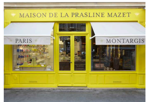
Maison de la Prasline Mazet 34 rue des Archives – 75004 Paris