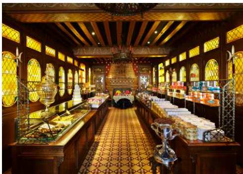
Maison historique de la Prasline Mazet 43 Rue du Général Leclerc, 45200 Montargis