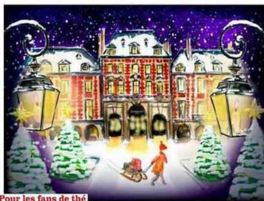
Pour les fans de thé Sachets Cristal contenant différents thés aromatisés, Dammann Frères, 19 € les 48 g.