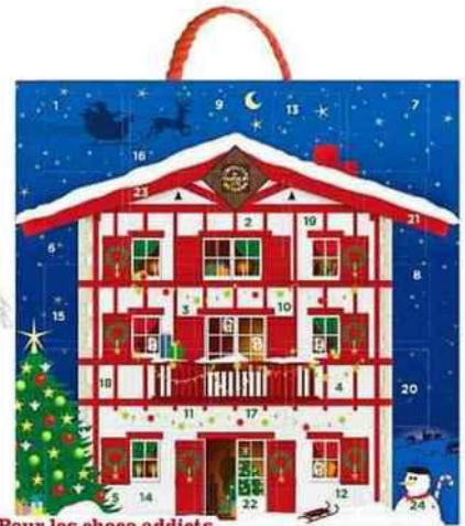
Pour les choco addicts Bouchées en chocolat, Atelier du Chocolat, 18,50 € les 240 g.