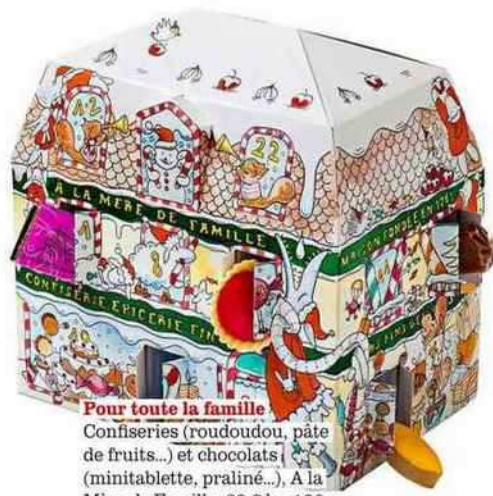
Pour toute la famille Confiseries (roudoudou, pâte de fruits...) et chocolats (minitablette, praliné...), A la Mère de Famille, 39 € les 190 g.

Petit ou grand, fan de thé ou choco addict, il y a forcément un calendrier de l'Avent pour patienter avec gourmandise.