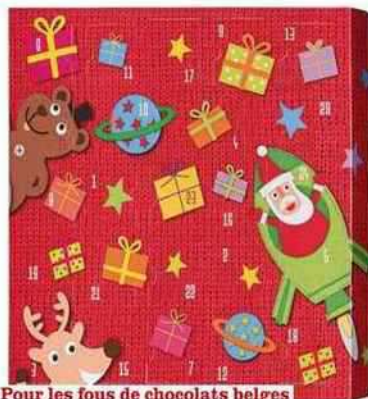
Pour les fous de chocolats belges Bouchées crémeuses, Jeff de Bruges, 13,95 € les 236 g.