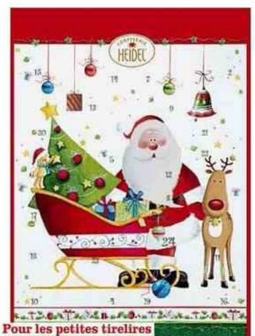
Pour les petites tirelires Petits chocolats, Heidi chez Monoprix, 3,45 € les 75 g.