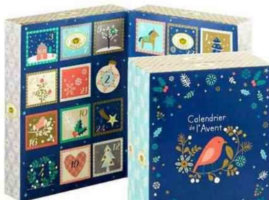
Pour les cœurs tendres Une création Mini Labo et Mazet pour un livre habillé de 24 spécialités (praline, pâte de fruits, nougat...), Mazet, 19,70 € les 210 g.