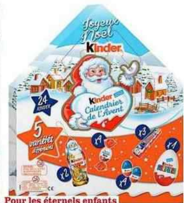
Pour les éternels enfants Cinq variétés de confiserie, Ferrero, 8,99 € les 182 g.