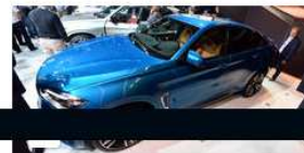
A Los Angeles, les voitures roulent des mécaniques