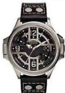
Montre Recruiter, 179 € (Fossil). Porte-documents en cuir de veau, 460 € (Longchamp).