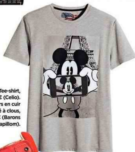
Tee-shirt, 19,90 € (Celio). Sneakers en cuir suédé à clous, 225 € (Barons Papillom).