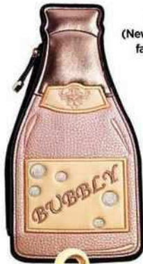
Pochette façon cuir, 14,99 € (New Look). Carafe et verre en cristal, façonnés à la main, 65 € (Nude).