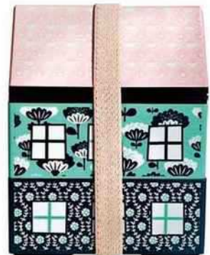
Maison Bento, deux compartiments et gel rafraîchissant, 28 € (Mini Labo). Coffret seau à glace Mouton Cadet Blanc et 6 boules en verre soufflé, 49 € (Mouton Cadet).