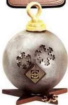
Boule en chocolat extranoir, 36 € les 300 g (L'Atelier du Chocolat).