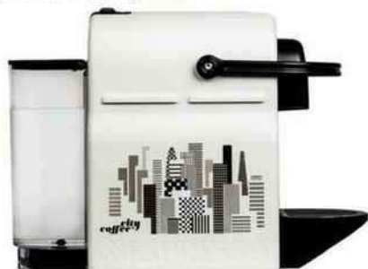
Machine Inissa série limitée, à partir de 119 € (Nespresso).