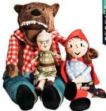
Loup et grand-mère, 9,99 €, Petit Chaperon rouge, 4,99 €, opération solidarité avec l'Unicef jusqu'au 14 décembre (Ikea). Bûche Place Blanche, 8 pers., 96 € à partir de mi-décembre (Café Pouchkine).