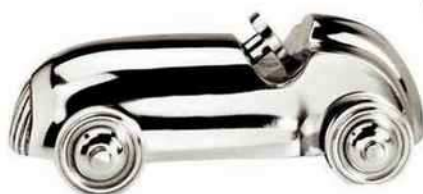
Presse-papiers en aluminium, 34 € (Sema Design).