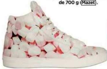
Baskets imprimées guimauves, 139 € (American Collège). Coffret de 8 spécialités, 97,30 € la boîte de 700 g (Mazet).