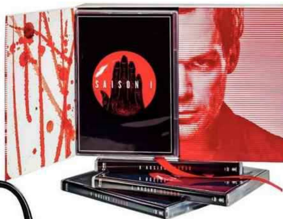
Coffret Dexter , 35 DVD, saisons 1 à 8, 89,99 € (Paramount).