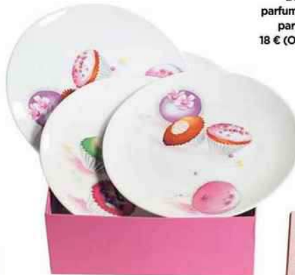
Coffret de 6 assiettes à dessert, 35 € (Geneviève Lethu).