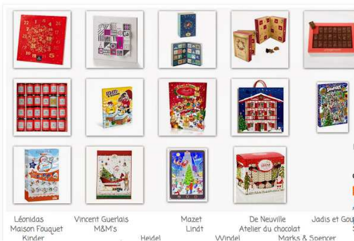
Léonidas Maison Fouquet Kinder Vincent Guerlais M&M's Mazet Lindt De Neuville Atelier du chocolat Wwindel Jadis et Gouffier Marks & Spencer