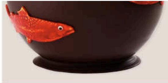
Le magnifique Bocal de Jean-Paul Hévin... A remplir de plein de friture...