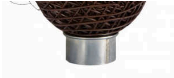
Le trésor caché des Fées Pâtisseries

Pour Clémence –mon padawan, souvent secrète, mais toujours pleine de surprises... Le Trésor Caché des Fées Pâtisseries... rempli d'oeufs aux pralinés cacahuètes, noisettes ou amandes, mousse caramel, ou caramel beurre-salé, de mini-tablettes de chocolat croustillant lait coco ou blanc coco et de friture aux trois chocolats. Une corne d'abondance bien dissimulée quoi !