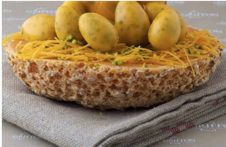
L'oeuf de Pâques de Claire Griffon , en mimolette extra-vieille et aux pistaches. Une tuerie!

Il n'y pas de Pâques sans chasse aux œufs ni sans œufs de Pâques, justement. Qu'il soit salé ou sucré, cette petite forme parfaite ravit les enfants et les plus grands... je le prouve immédiatement avec le jeu des 7 familles: