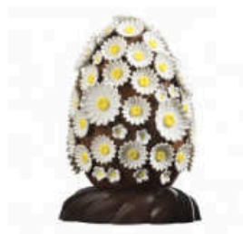
Tête de pâquerette Oeuf en chocolat grand cru Nyangbo 68%, couvert de pâquerettes en sucre, garni de fruits secs torréfiés enrobés de chocolat, Christophe Roussel, 38€