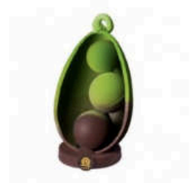
Le petit pois Oeuf cosse au chocolat noir 72% pure origine Madagascar décor vert petit pois en chocolat blanc