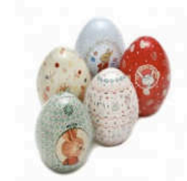
La surprise Oeuf contenant un t-shirt enfant et des feutres textiles pour colorier le motif rigolo, Sergent