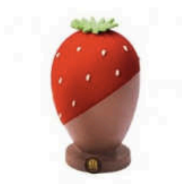
La fraise Oeuf en chocolat au lait 43% pure origine Madagascar, décor rouge fraise en chocolat blanc