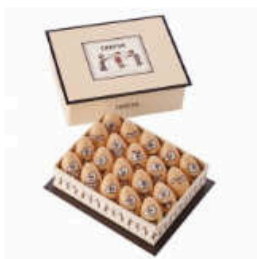
En bande 20 petits oeufs en chocolat blanc fourrés pralinés, Patrice Chapon, 30€