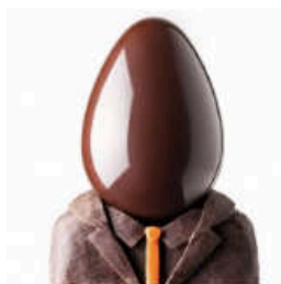
Tête d'Oeuf Oeuf en chocolat noir ou lait garni de fritures de Pâques, A la Mère de Famille, 36 €