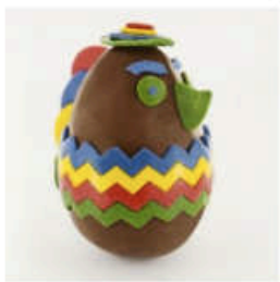
Le Mexicain Chocolat au lait du Mexique et pâte d'amandes, 12 cm, Daniel Mercier pour La Grande Epicerie,