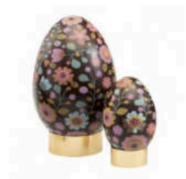
Camouflage Oeuf en chocolat noir 200g imprimé, garni d'oeufs feuilletés et de mouettes au chocolat noir et blanc, Mini Labo chez Mazet confiseur, 22,90€