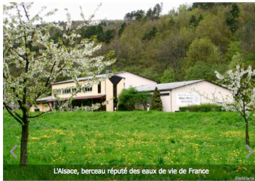
L'Alsace, berceau réputé des eaux de vie de France