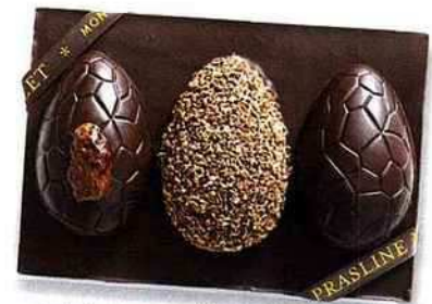
Tableau de Pâques

Trois œufs où la douceur du chocolat rencontre le croquant de la praline. Par la confiserie [Mazet] spécialiste de «praslines» à Montargis. Tableau de Pâques Mazet, 9,90 € (130 g).