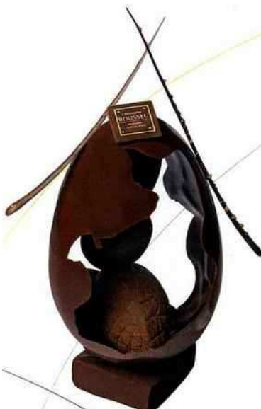
Grand crus Aux trois chocolats, Origines, Christophe Roussel, 35 €, 28 cm. christophe-roussel.fr