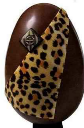
African Au lait, décoration panthère en pâte d'amandes, Atelier du chocolat, 33,10 €, 17 cm. atelierduchocolat.fr