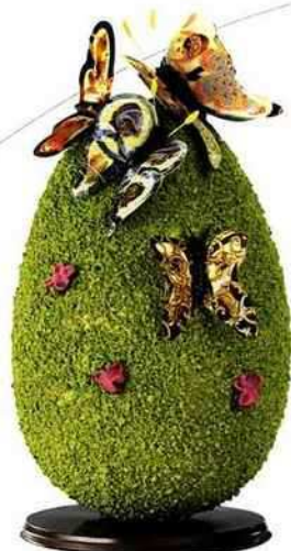
Printanier Couvert de pépites de citron confit, papillons en chocolat, Chocolat Chapon, 71 €, 22 cm. chocolat-chapon.com