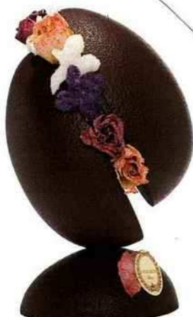
Déstructuré Aux pétales de fleurs cristallisés, Œuf pétale, Ladurée, 75 €, 17 cm. ladurée.com