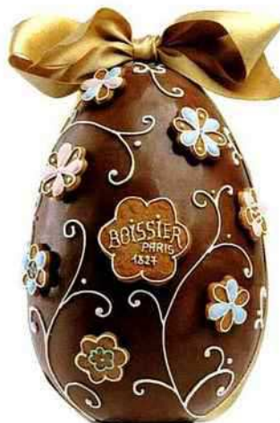
Floral Décoré de fleurs en pain d'épice, Boissier, 75 €, 21 cm. maisonboissier.com