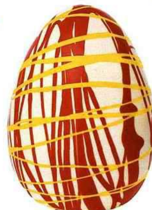
Graphique En chocolat blanc, La Fée chocolat, 35 €, 20 cm. monoprix.fr