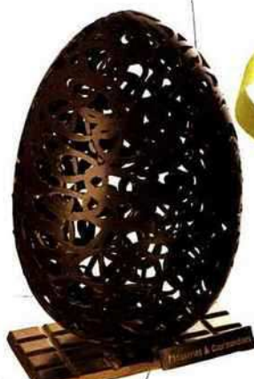
Dentelle Sur une plaque de chocolat noir, Stéphane Glacier, 28 €, 20 cm. stephaneglacier-lecole.com