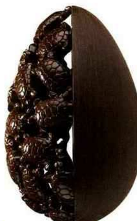
Nature En chocolat noir, Œuf tortue, Jean-Paul Hévin, 65,80 €, 16 cm. jphevin.com