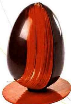
Peint Garni de friture en pratiné, noir et lait, Hugo & Victor, 16 €, 12 cm. hugovictor.com