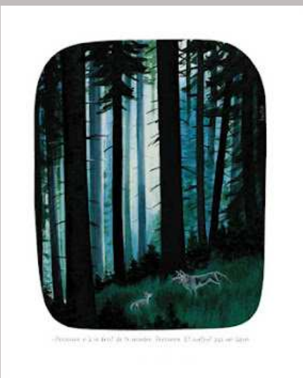
- Personne n'a le droit de te mordre. Personne. Et SURTOUT pas un lapin...